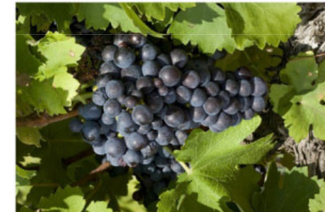
Groupe de coulisses

Vous cultivez des cépages patrimoniaux rares sur votre exploitation ? Participez à l'enquête européenne destinée à inventorier les acteurs "à la ferme" des cépages rares en Europe. Objectif : participer à leur préservation.