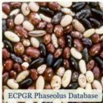
ECPGR Phaseolus Database