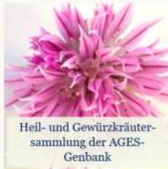
Heil- und Gewürzkräuter- sammlung der AGES- Genbank