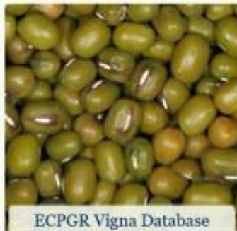
ECPGR Vigna Database

Dieses Nationale Verzeichnis Österreichs ist die zentrale Dokumentation zu allen ex-situ-Sammlungen an pflanzengenetischen Ressourcen für Ernährung und Landwirtschaft in Österreich. Finden Sie hier Informationen über die Bestände in österreichischen Genbanken, über die Suche nach Passportdaten, wie auch nach botanischen und Volksnamen. Weiters sind auch Informationen über Aufwuchsmerkmale und Fotos abrufbar.